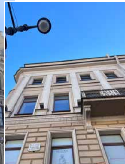
Невский, 71/1 Современный облик доходного дома Зайцева

Поверите, что доходный дом Зайцева XIX века — самое оживлённое место в нашем округе? Встроенная станция метро, торговый центр, рестораны — речь о доме на углу Невского проспекта и улицы Марата.