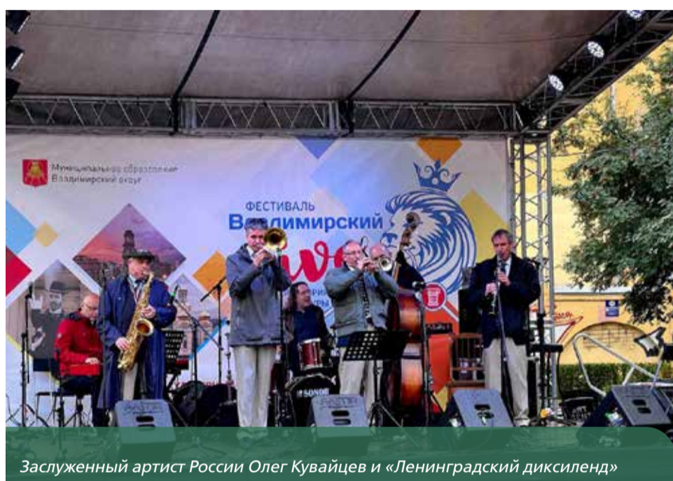
Заслуженный артист России Олег Кувайцев и «Ленинградский диксиленд»