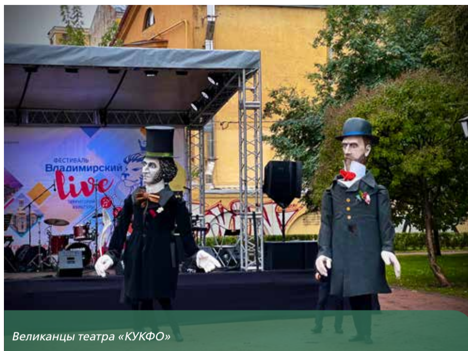
Великаны театра «КУКФО»