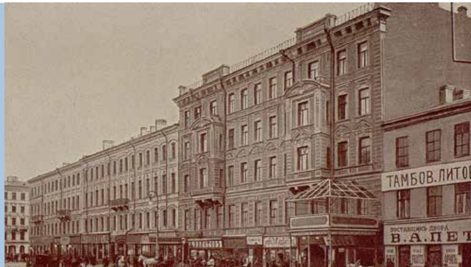
Дома 71 (слева), 69 и 67 на панораме Невского проспекта

Вся история России XVIII века — идеальный материал для Александра Дюма. В XIX веке таким Дюма старался стать Данилевский, в XX — Валентин Пикуль. Ныне тексты обоих, скорее, забыты.