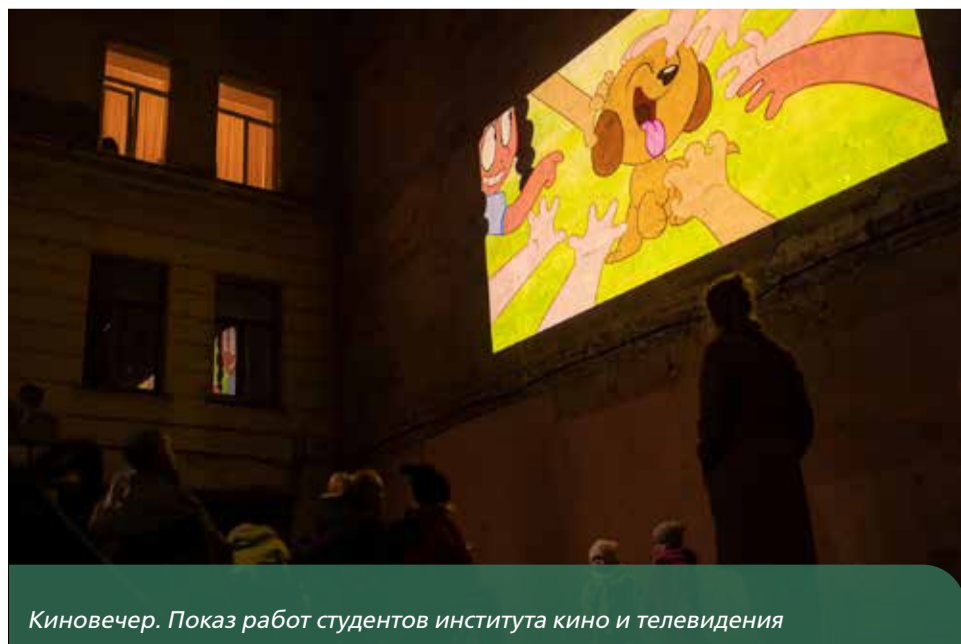
Киновечер. Показ работ студентов института кино и телевидения