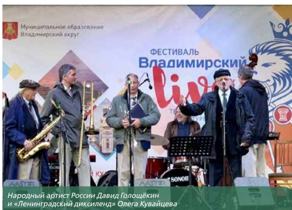
Народный артист России Давид Голощёкин и «Ленинградский диксиленд» Олега Кувайцева