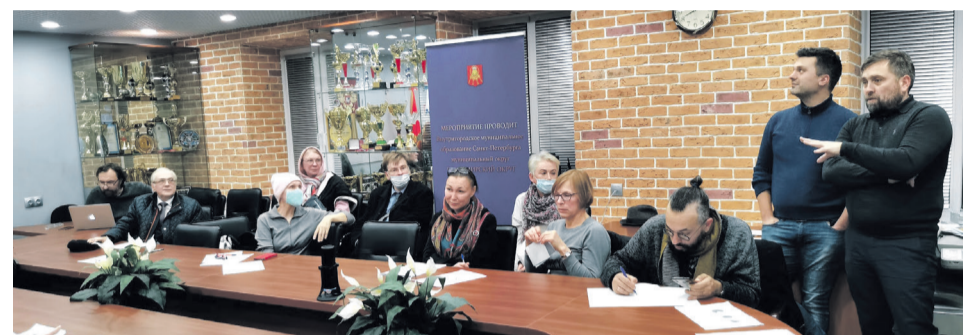
Сессия соучаствующего проектирования по объекту благоустройства двора домов 3-5 на ул. Правды. Октябрь, 2021 г.

упали в 5 раз! В новых условиях выполнять проекты благоустройства возможно только с привлечением городских субсидий. А процесс получения субсидий непростой и довольно долгий — это колоссальная работа. Проекты благоустройства, которые муниципалитет выполнил в этом году, были разработаны совместно с жителями на сессиях соучаствующего проектирования в 2021 году отдельно по каждому адресу. На встречах предлагались, обсуждались и принимались за основу пожелания жителей. После создания и утверждения проектов в 2022 году была