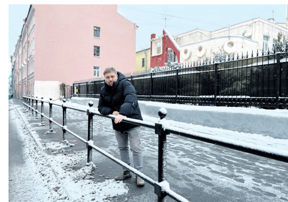
На улице Джамбула у детского сада № 19 появились дорожные ограждения.

Вопрос по нашему обращению рассматривали на заседаниях Комиссии по обеспечению безопасности дорожного движения, по итогам которых началась разработка адресной программы по установке пешеходных ограждений. Комитет по вопросам законности, правопорядка и безопасности включил адрес на Джамбула в список первоочередных на установку ограждений на 2023 год. Также запрос на усиленный контроль правил парковки до установки ограждения по этому адресу был передан в ГИБДД.