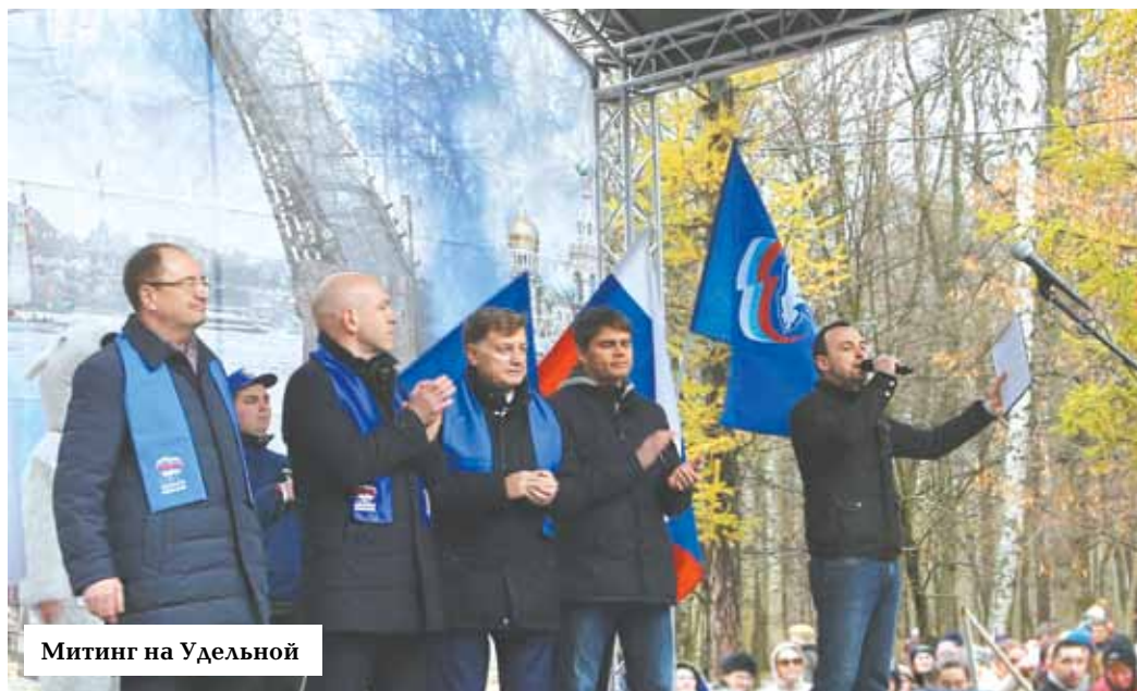
Митинг на Удельной